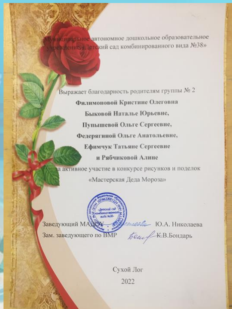
«Новый год у ворот»