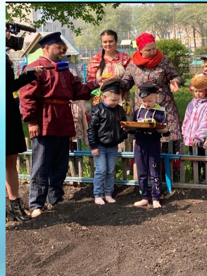
Участники муниципального проекта «Семейные выходные»