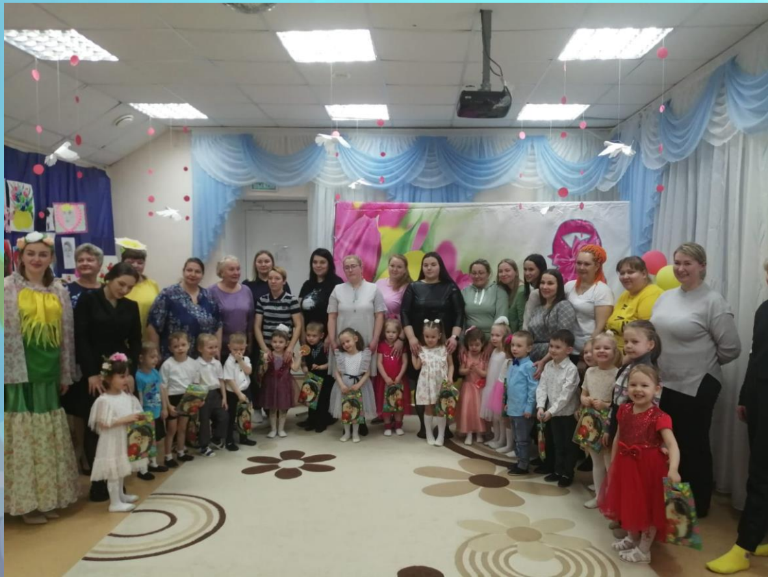
«Весна пришла, всем радость принесла!»