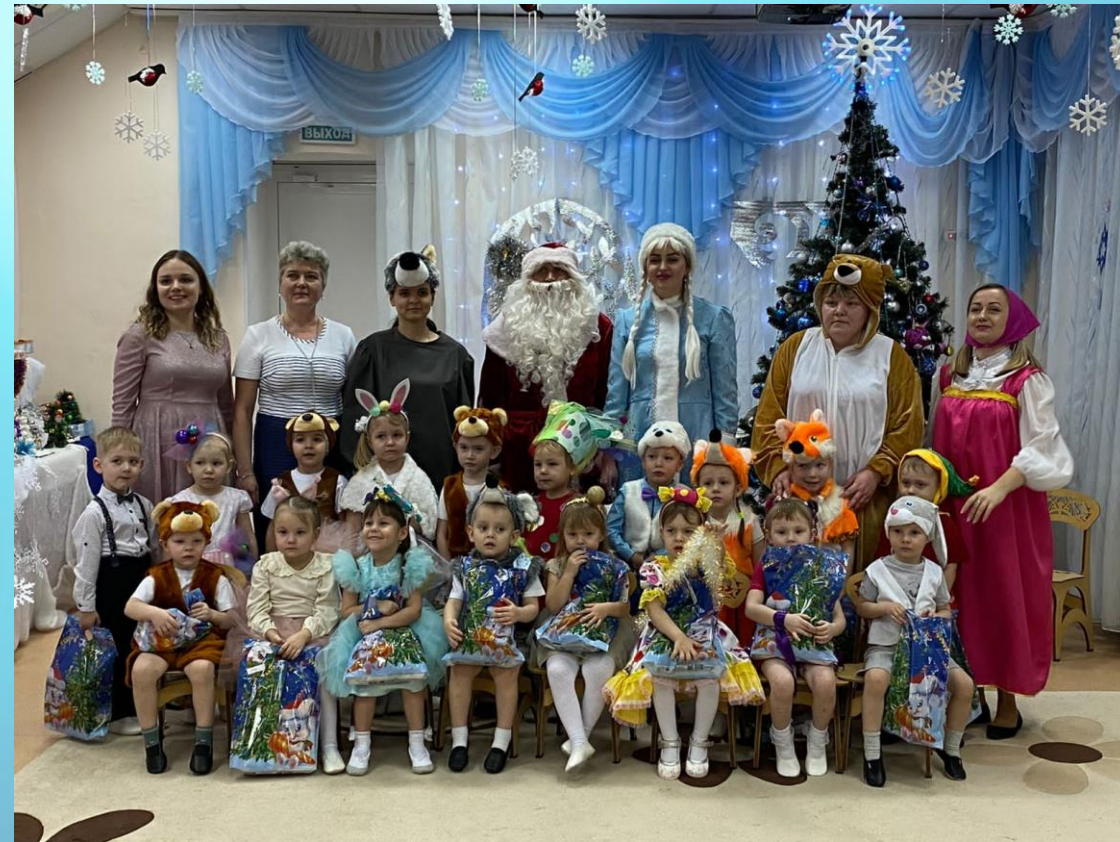
«Машенька и медведь»