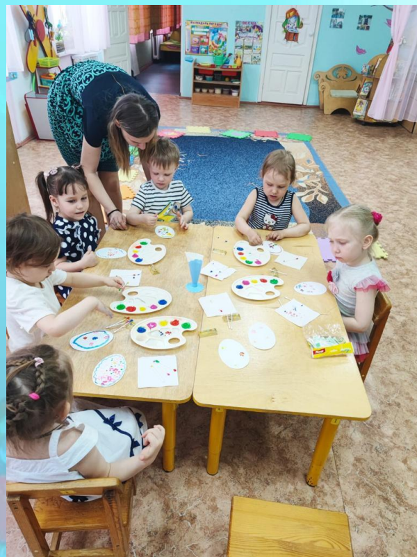
«Центр изобразительного творчества»