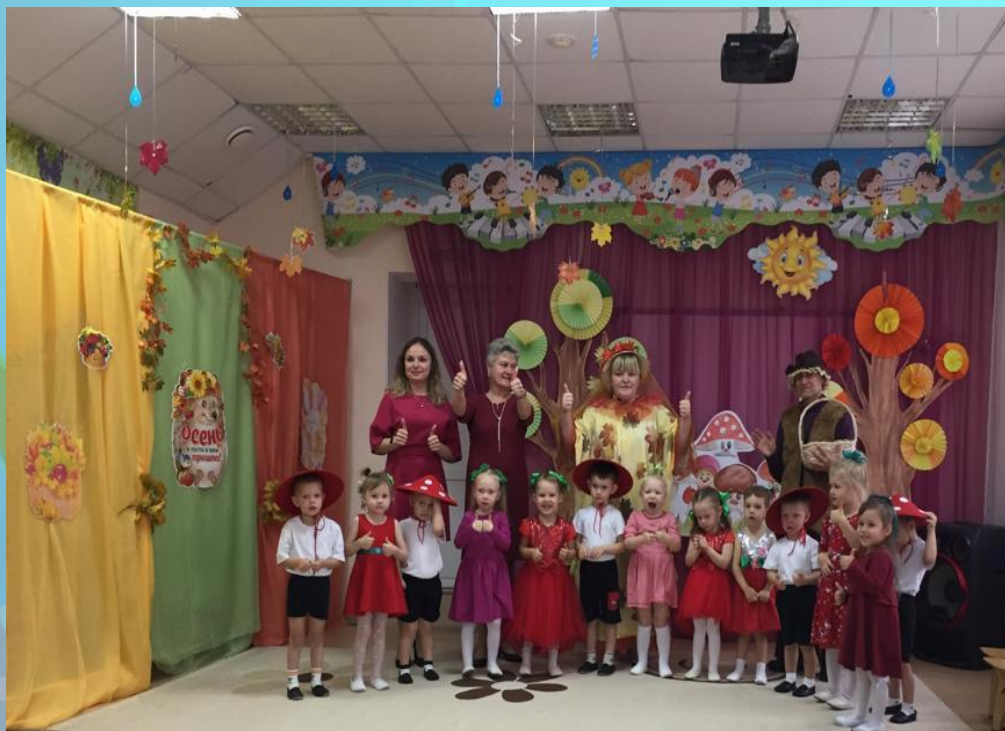
«В гостях у Лесовичка»